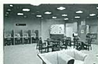
清張を語る、触れるライブラリーです