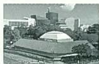
都心の閑静な小倉城内のミュージアムです