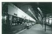
ミステリアスに回廊を巡る常設展示室