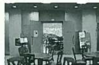
清張めぐりの後は、喫茶室「石の館」で寛ぐ