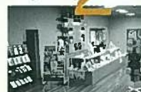
いち押し清張グッズのミュージアムショップ