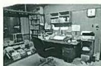
清張が執筆し続けた書齋をそのままに再現